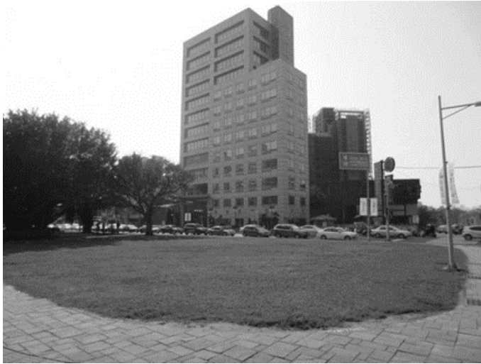
圖 2 綠園道食物森林建置前的地景