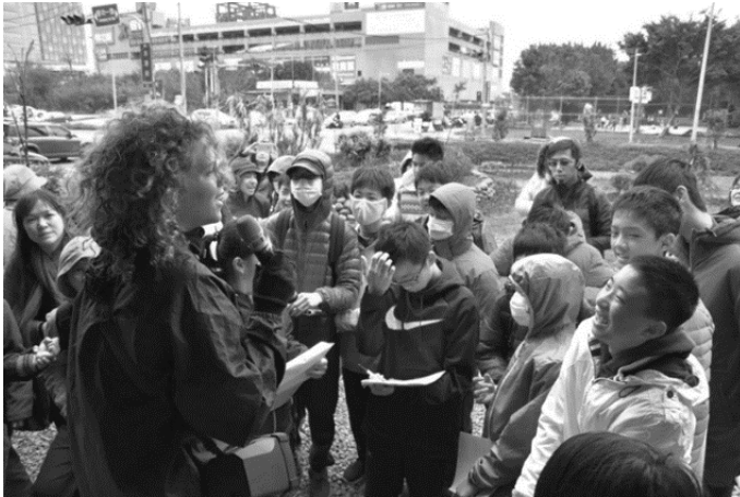
圖 12 梧桐專員進行環境教育解說

由此可見，空間氛圍的形塑並非是一時之間可以完成，除了團體內部的交流之外，與外部社群的互動亦為建置公共空間不可或缺的一環。縱使面對外界的質疑，志工們仍非常願意和來訪者進行交流，一同討論有關農耕或環境倫理等知識，也可從外人的建議中獲得再次進步的想法與動力。