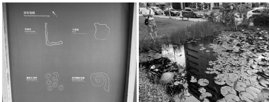
圖 8 食物森林空間配置示意圖與生態池