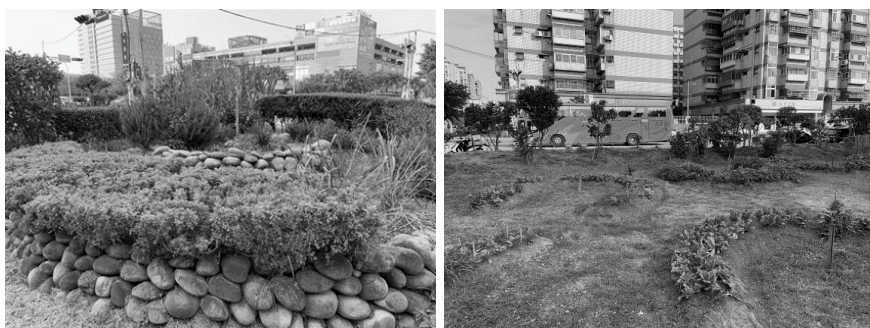
圖 7 螺旋菜園與馬蹄形菜園

螺旋菜園、馬蹄狀菜園和生態池都是符合生態層次去建立的。剛開始種的也是蠻辛苦的，大家種什麼失敗什麼，後來梧桐他們指導才慢慢的成功，現在每種必活！（受訪者 B01，2020/09/10，當面訪談）