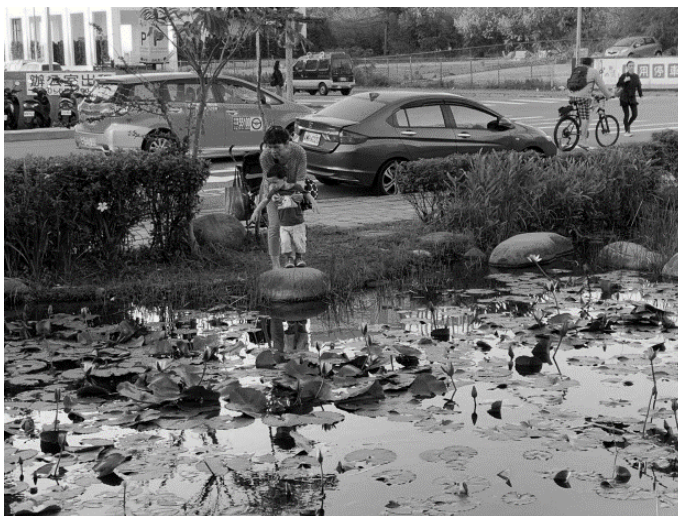
圖 10 民眾於食物森林生態池邊觀察