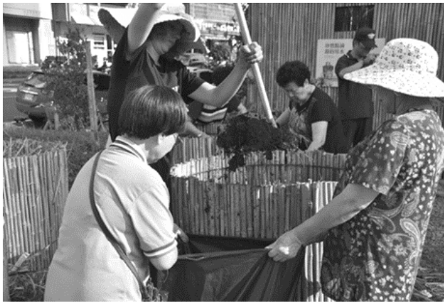
圖 6 志工們與梧桐成員共同製作堆肥

我們連塑膠繩子都沒有用，很簡單就是為了環保嘛，也跟食物森林核心的友善環境呼應，雖然一開始會覺得有點不習慣，跟以前自己種菜的方式差很多，但慢慢覺得這才是對環境好的。(受訪者 B04，2020/09/10，當面訪談)