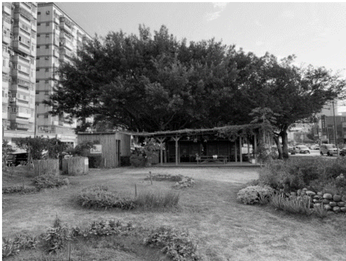
圖 3 綠園道食物森林現況