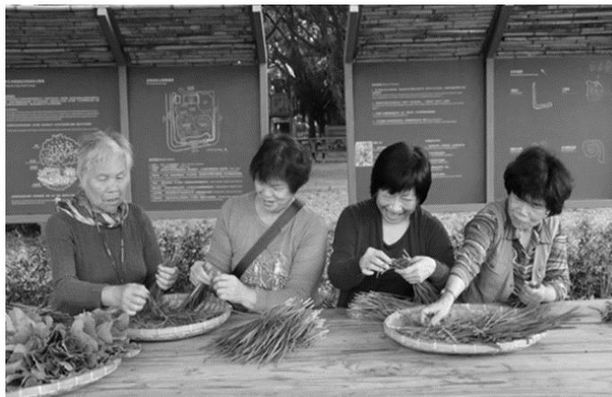
圖 11 志工們在涼亭檢選蔬菜並討論耕種細節