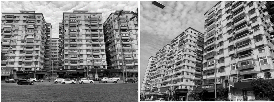
圖 4 位於食物森林旁的國宅「公學新城」

誠如上述受訪者所述，走出家門，與鄰里共同參與食物森林，除了可以重拾過去鄉村耕種的經驗，亦可增進自身的身心靈健康。平時盡心盡力地維護周邊環境，食物森林的出現，讓這些志工長者有機會參與城市公共空間的營造，出於高度意願與愛護家園的情況下，社區長者們自願投身食物森林的經營行列。