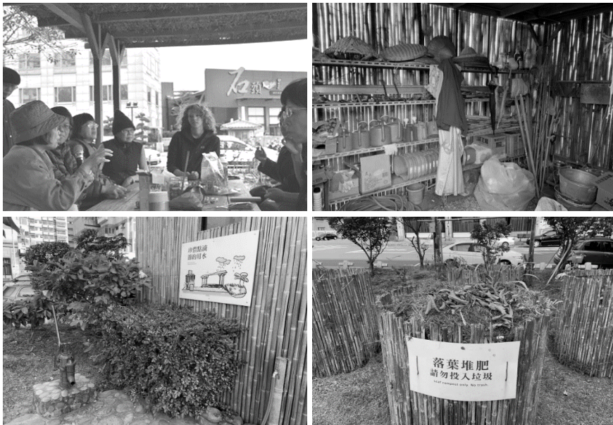
圖 5 參與式規劃設計討論過程與成果

那時候梧桐還有一位法國來的(國際專員)，長得很漂亮，中文也說的很好，提供給我們很多資訊，啊讓我們這些老人家可以慢慢地講出自己的想法，不怕說對還是錯，感覺很好。(受訪者 B07, 2020/09/10, 當面訪談)