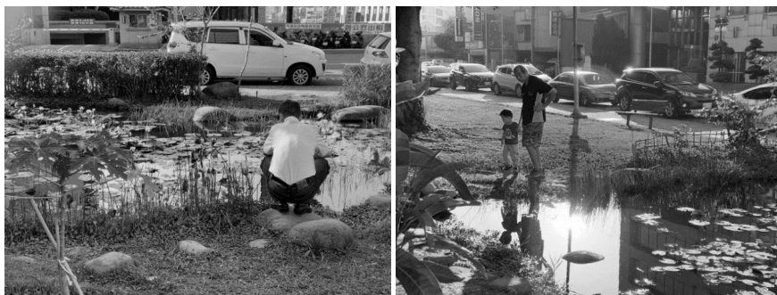
圖 13 民眾駐足接近食物森林

綜上所言，當教育不囿於教室裡，而是存在城市的每一個角落，展現整個城市都是我的教室的宏觀概念。此外，傳授知識的不僅限於教師，更多的是對城市空間付出心力的每位公民，經過他們日常生活的經驗與體會，呈現出生命教育的意義，以潛移默化的方式深植眾人的心中。