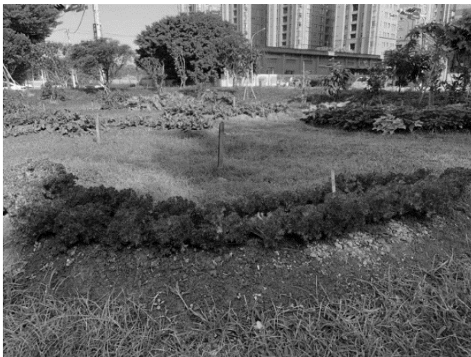
圖 9 周邊微高土丘的視覺穿透性